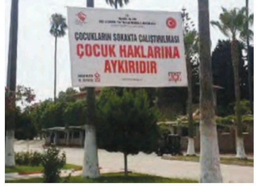
Görsel 19: Ata Yayıncılık, 5. sınıf, s. 27.

riskinden korumak için herkesin yapacağı birçok şey vardır. Bunlardan en önemlisi trafik ışıklarında, caddelerde dilenen ya da cam silen çocuklara para vermemektir. Çünkü kendini ve sürücülerini trafikte tehlikeye atarak dilenen ya da cam silen çocuklar, zamanla sokağa bağımlı hâle gelip evlerinden ve okullarından kopuyor... Çocuklara destek olmak istiyorsak onlara para vererek değil onları yardım kuruluşlarına yönlendirerek, onların eğitimlerine devamını sağlayarak destek olabiliriz. Mobil ekiplerimiz aracılığı ile tespit ettiğimiz çocukların ailelerine devletimiz gerekli yardımı yapmaktadır. Çocukların yeri evleri, okul ve oyun merkezleridir.” (s. 27)