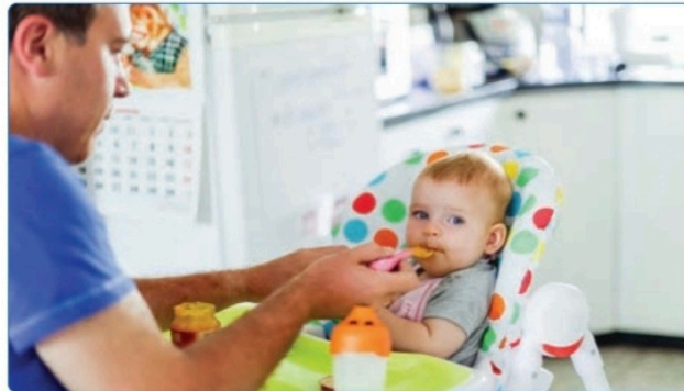
Görsel 5: MEB Yayınları, 6. sınıf, s. 27.