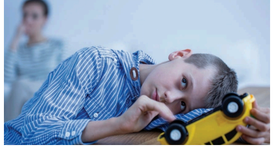
Görsel 21: MEB Yayınları, 6. sınıf, s. 30.

Yukarıda paylaştığımız iki örnekte, diğer örneklerde rastlamadığımız bir durum söz konusu. Ayrımcılığa uğrayan kişilerin deneyimleri aktarılırken bir anlatıcıdan değil, bizzat kendilerinden öğreniyoruz. Kişiler deneyimlerini aktarırken toplumdaki önyargılı tutumlara işaret ediyor. Ayrımcılığın önlenmesi ve eşitliğin sağlanmasında önyargıları fark etmek ve anlamak için çaba harcamak önem arz ediyor. Bunun için Ayrımcılık: Çok Boyutlu Yaklaşımlar başlıklı yayında Melek Göregenli’nin kaleme aldığı “Önyargıyı ve Ayrımcılığı Azaltmak” başlıklı makaleyi (Göregenli, 2012) incelemek faydalı olabilir. Makalede, kalıpyargı, önyargı ve ayrımcılık arasındaki ilişki çözümleniyor. Önyargı ve ayrımcılığı azaltmaya yönelik stratejiler paylaşılırken bireysel düzeyde zihinsel dönüşümlerin önemine değiniliyor; ancak bu dönüşümlerin toplumsal dönüşümler ile bir arada ve birbirini pekiştirerek gerçekleştirilebileceğine de dikkat çekiliyor.