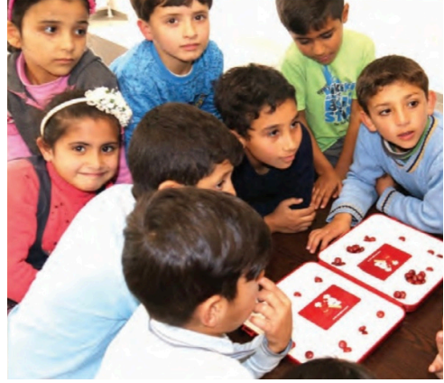
Görsel 9: Anadol Yayıncılık, 6. sınıf, s. 230.

Türkiye'de buldukları için aslında şanslı olduklarını söyleseler de üzgünler. İnsanların evlerinden ve alışkanlıklarından koparak yabancıları oldukları bir ülkede yaşamaları ne kadar zor " (s. 25). Anlatıcı böyle bir durumda ne yapmamız gerektiğini şöyle ifade ediyor: " Ben kendimi onların yerine koyunca içinde buldukları durumu daha iyi anlıyorum. Onlara elimizden geldiğince yardımcı olmamız gerektiğini düşünüyorum. " (s. 25)