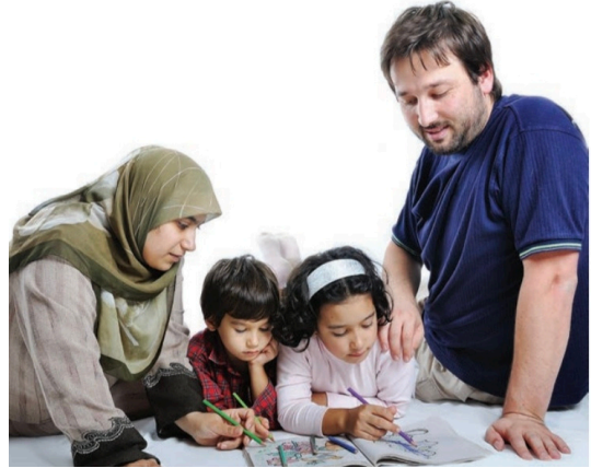
Görsel 7: MEB Yayınları, 5. sınıf, s. 21.

Sosyal Bilgiler ders kitaplarında başörtülü kadın temsillerine bu örnek dışında da rastlıyoruz. 4. sınıf ders kitabında (Tuna Matbaacılık) çocuk hakları (s. 154), 5. sınıf ders kitabında (MEB Yayınları) ailedeki rol ve sorumluluklar (s. 21), 6. sınıf ders kitabında (MEB Yayınları) aile içi demokrasi (s. 208) konu edilirken paylaşılan aile görsellerinde başörtülü kadınlar yer alıyor.