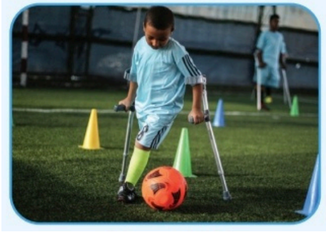
Görsel 16: Ferman Yayınları, 4. sınıf, s. 23.