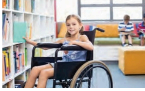
Görsel 13: Ata Yayıncılık, 5. sınıf, s. 23.

Ortopedik engellilik dışındaki engellilik türleri Sosyal Bilgiler ders kitaplarında nadiren karşımıza çıkıyor. 4. sınıf ders kitabında (Ferman Yayınları) bir çocuğun yardımıyla karşıya geçen görme engelli bir kişiye (s. 26) yer veriliyor, 6. sınıf ders kitabında (Anadol Yayıncılık) 21 Mart Down Sendromu Farkındalık Günü (s. 20) konu ediliyor ve 6. sınıf ders kitabında (MEB Yayınları) otizmli çocuğu olan bir ebeveynin yaşadıkları (s. 30) anlatılıyor.