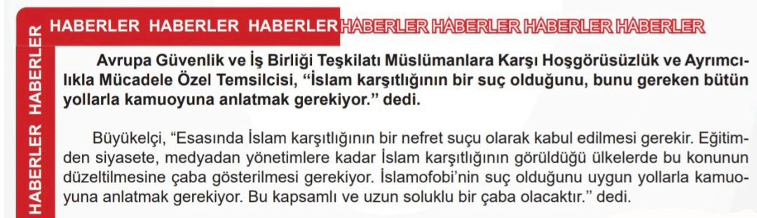
Görsel 24: MEB Yayınları, 7. sınıf, s. 195.

7. sınıf ders kitaplarında demokrasi ile yönetilen pek çok toplumda antidemokratik uygulamalar konu edilirken yalnızca ‘biz’i tehdit eden olayların ele alındığını görüyoruz. MEB Yayınları tarafından yayımlanan ders kitabında “Myanmar’da yerlerinden edilmiş 100 binden fazla Arakanlı Müslüman’ın kaldığı kamplara yapılan saldırılar; Suriye İç Savaşı ile vatanlarını terk edip başka ülkelere sığınmak zorunda kalmış olan sığınmacılar” (s. 189) anılıyor. Demokratik ülkelerde görülen antidemokratik uygulamalardan biri olarak İslamofobi öne çıkarılıyor. Avrupa Güvenlik ve İş Birliği Teşkilatı Müslümanlara Karşı Hoşgörüsüzlük ve Ayrımcılıkla Mücadele Özel Temsilcisi’nin sözlerine yer verilen haberde (s. 195) İslam karşıtlığının bir nefret suçu olarak kabul edilmesi ve bunun gereken bütün yollarla kamuoyuna anlatılması gerektiği belirtiliyor.