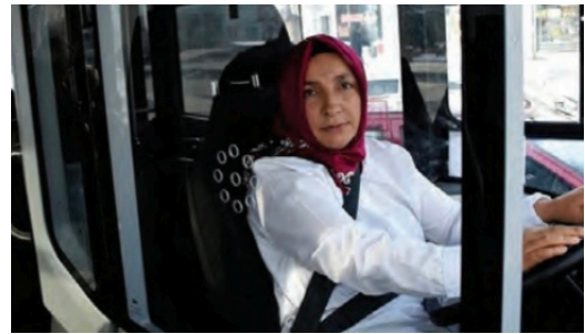
Görsel 8: Anadol Yayıncılık, 6. sınıf, s. 230.

Bunun yanı sıra 5. sınıf ders kitabında (Ata Yayıncılık) sağlık hakkı (s. 23) ve sivil toplum çalışmaları (s. 143); 6. sınıf ders kitabında (Anadol Yayıncılık) pozitif ayrımcılık uygulamaları (s. 230), 7. sınıf ders kitabında (MEB Yayınları) Türkiye demokrasi tarihi konu edilirken paylaşılan görsellerde çeşitli mesleklerden başörtülü kadın temsilleri de sunuluyor.