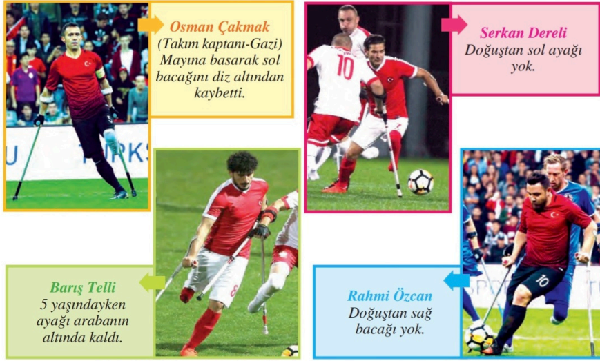
Görsel 12: Tuna Matbaacılık, 4. sınıf, s. 29.

İnançlı ve azimli çalışmalarının sonunda zafere ulaşarak ülkemize büyük bir sevinç ve gurur yaşattılar.” (s. 29)