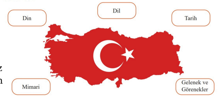
Görsel 22: MEB Yayınları, 6. sınıf, s. 17.

Buna karşın, aynı kitabın Bizi Biz Yapanlar başlıklı konusunda yukarıda örneklediğimiz anlayışın tam tersi bir yaklaşımla karşılaşıyoruz. Kimliklerin gökkuşağının bir rengi olarak yalnız başına anlamını yitirdiği ve bütünü içerisinde rengini kaybettiği bir anlayış. Bu anlayış “ milletimizin her ferdini ‘biz’ duygu ve düşüncesi