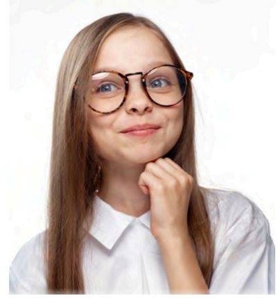
Görsel 1: Tuna Matbaacılık, 4. sınıf, s. 10.

4. sınıf ders kitabında (Tuna Matbaacılık) bütün kitap boyunca anlatıcı olan bir karakter bulunuyor ve kitap bu karakterin kendini tanıtmaya başlıyor: Sosyal Bilge, duygusal biri, müzik dinlemeyi ve satranç oynamayı seviyor (s. 10). Sosyal Bilge'nin ardından birçok karakter kendini bize kısaca tanıtıyor. Bu karakterlerin her birinin isimlerini, ilgi alanlarını, ihtiyaçlarını ve yeteneklerini öğreniyoruz (s. 19). Ardından, hikâyesine yer verilen Küçük Picasso takma adlı kız çocuğun hikâyesiyle karşılaşyoruz. Küçük Picasso hem üstün yetenekli hem de başarılar elde etmiş, Türkiye birinciliği ve dünya ikinciliği bulunan, üç kişisel sergi açmış bir ressam (s. 21).