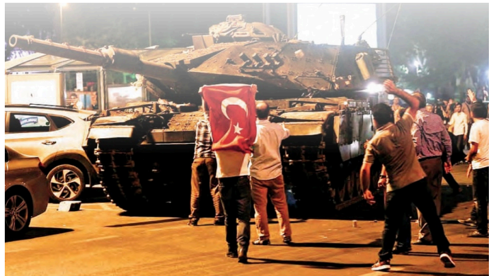
Görsel 23: Tuna Matbaacılık, 4. sınıf, s. 170.

Kitaplarda ‘biz’in sınırları çizildikten sonra ‘biz’in bütünlüğünü ve birliğini tehdit eden unsurlar da konu ediliyor. 4. sınıf ders kitabında (Tuna Matbaacılık) “ 15 Temmuz gecesi kahraman Türk milleti’nin tankların önüne korkusuzca yatarak ve göğsünü kurşunlara siper ederek darbe girişimini bastırdığı ” ve “ böylece tek