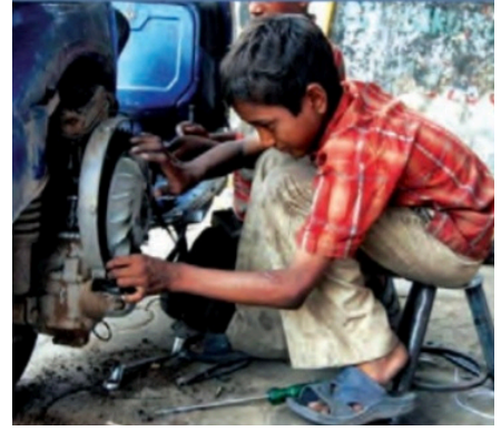
Görsel 18: Tuna Matbaacılık, 4. sınıf, s. 155.

Kitaplarda haklardan yararlanmada dezavantajlı konumda sunulan gruplar arasında çalışan çocuklar da ele alınıyor. 4. sınıf ders kitabında (Tuna Matbaacılık) “çalışmak zorunda bırakılan kardeşlerimiz” olarak anılan çocukların başta eğitim olmak üzere bütün haklardan yoksun kaldıkları belirtiliyor; “ne yapacaklarını, nereye başvuracaklarını bilemeyecekleri” söylenerek “bu çocuklara haklarının neler olduğunu ve hangi kurumlardan destek alabileceklerini öğretmemiz” öneriliyor (s. 155).