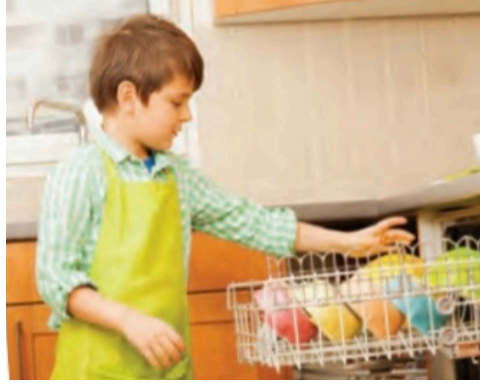
Görsel 4: Tuna Matbaacılık, 4. sınıf, s. 157.

Kitaplarda oğlan çocuklar ve erkeklerin cinsiyetçi kalıpların dışında temsil edildiği örneklerle yer veriliyor. Oğlan çocukların ev işi yaptığına, erkeklerin çocuk bakımını üstlendiğine ve ev işi yaptığına rastlıyoruz. Sosyal Bilgiler 4. sınıf ders kitabında (Tuna Matbaacılık) bulaşıkları makineye yerleştiren bir çocuk (s. 157), 6. sınıf ders kitabında (MEB Yayınları) çocuğuna yemek yediren bir baba (s. 27) ve 7. sınıf ders kitabında (MEB Yayınları) hep birlikte ev temizliği yapan bir aileyle (anne, baba, oğlan çocuk ve kız çocuk) karşılaşlıyoruz (s. 196).