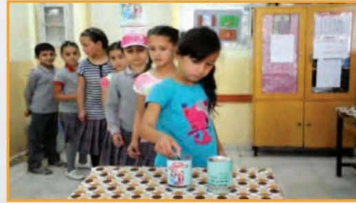
Görsel 11: Tuna Matbaacılık, 4. sınıf, s. 27.