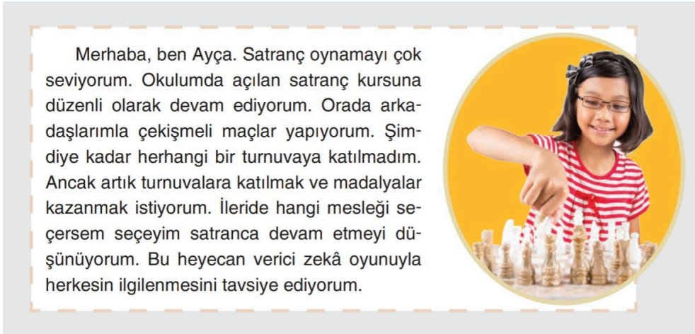
Görsel 2: Tuna Matbaacılık, 4. sınıf, s. 19.

Kitapların genelinde kız ve oğlan çocukların sayısal temsilde bir denge gözetilirken, içeriğin büyük bir kısmı cinsiyetçi kalıpları üretmeyecek şekilde sunuluyor. Hem çocuk hem yetişkin karakterlere sıklıkla yer verilen Sosyal Bilgiler 4 ve 5. sınıf ders kitaplarında çocuk karakterlerin cinsiyete göre dağılımına baktığımızda 53 karakterin 27'sini kız çocuklar, 26'sını oğlan çocuklar oluşturuyor. Yetişkinlerde ise, 49 karakterin 29'u (yaklaşık %60'ı) kadın. Kız çocuklar kitaplarda 'çevresine karşı duyarlı', 'sosyal yönü güçlü' olmanın yanı sıra kitap okumaktan bisiklet sürmeye, dans etmektan satranç oynamaya, müzik aleti çalmaktan zekâ oyunlarına ve üreten çocuk topluluğu kurmaya kadar çok çeşitli özellikler ve ilgi alanlarıyla da karşımıza çıkıyor. 4. sınıf ders kitabında (Tuna Matbaacılık) yer alan ve aşağıda alıntılıdığımız örneklerin ilkinde Ayça isimli bir çocuk satranca olan ilgisini belirtirken (s. 19), Ezgi isimli bir başka çocuk kurucusu olduğu topluluğun amaçlarını anlatıyor (s. 163).