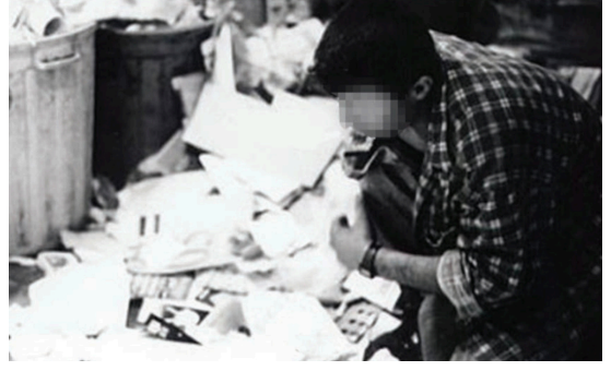
Görsel 20: MEB Yayınları, 6. sınıf, s. 29.

19 yaşında Ankara’da kâğıt toplayarak hayatını sürdüren genç “yürürken, kâğıt toplarken, sabahtan akşama bitap düşene kadar çalışırken hep insanların yüzlerini seyrettiğini ve okumak için kitap aldığı kitapçıların bile önyargılı olduklarını” anlatıyor (s. 29). Anne ise çocuğunun otizmlili olduğunu öğrenince olumsuz yaklaşımlara tepki gösteriyor ve “Mozart’ın otizmlili olduğunu biliyoruz, bu çocukların içinde bir Mozart aramak varken bu önyargı neden?” diye soruyor. “Çocuklarımızı saklamak, gizlemek, üstünü örtmek değil. Çocuklar saklandıkça, iyi yerlere gelen örnekleri görülmedikçe bu önyargılar devam edecektir.” diye ekliyor (s. 30).