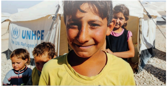
Görsel 10: MEB Yayınları, 5. sınıf, s. 27.

Mülteciler ilerleyen sınıf düzeylerinde de konu edilmeye devam ediyor. Kitaplarda Türkiye'nin çeşitli yerlerinde kurulan mülteci kamplarından görsellere yer verilerek mültecilerin ne kadar zorlu koşullarda yaşamak zorunda bırakıldıkları, ancak ülkemizin hâlâ destek vermeyi sürdürdüğü belirtiliyor.