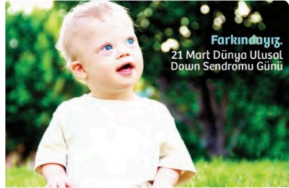
Görsel 15: Anadol Yayıncılık, 6. sınıf, s. 20.

Sosyal Bilgiler ders kitaplarında engellilerin eşit temsiline yer verilen örnekler az sayıda da olsa karşımıza çıkıyor. 4. sınıf ders kitabında (Ferman Yayıncılık) ilgi alanları ve yetenekler konu edilirken paylaşılan bir görselde koltuk değneği kullanan ampute bir çocuk (s. 23), 7. sınıf ders kitabında (MEB Yayınları) Türkiye demokrasi tarihi üzerine sohbet eden öğretmenlerin öğrencilerinden biri tekerlekli sandalye kullanıcısı (s. 189) olarak görselleştiriliyor. Bu örneklerde olduğu gibi, ders kitaplarında engellilerin ve çeşitli toplumsal grupların 'farklılık'ları işaret edilmeden diğer gruplarla eşit şekilde temsil edilmesi engelliliğin ve her türlü kimliğin olağanlaşması açısından önemli ve gereklidir. Ders kitaplarında bu tür temsillerin çoğaltılması, farklılıkların olağanlaşmasına katkı sunacaktır.