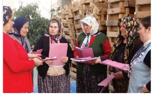
Görsel 6: MEB Yayınları, 5. sınıf, s. 16.

Aile hayatındaki rollerden toplumsal hayattaki rollere birçok konudaki kadın temsillerini incelediğimizde iyi örnekler rastlıyoruz. Örneğin, Sosyal Bilgiler 5. sınıf ders kitabında (MEB Yayınları) köy kadınlarının deneyimlerini tüm dünyaya göstermek için 2001 yılında kurulan Arslanköy Kadınlar Tiyatro Topluluğu konu ediliyor. Topluluğun çeşitli ödülleri almaya hak kazandığı da belirtilerek, yaptıkları filmin Ümmiye Koçak'a New York Avrasya Film Festivali'nde Sinemada En İyi Avrasyalı Kadın Sanatçı ödülünü kazandırdığı anlatılıyor.