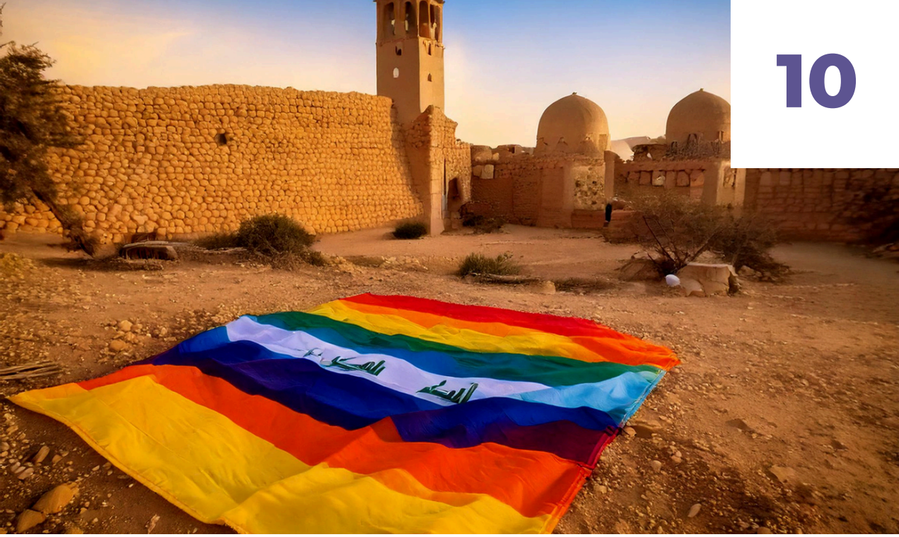
Görsel Tercüme: Irak

2005'ten bu yana Irak'ta devlete bağlı ya da devlet destekli silahlı gruplar, LGBTİ+ olarak işaretlenen kişilere yönelik kaçırma, işkence ve idam etme eylemlerini sürdürmektedir.[27] 2009 yılında Iraklı silahlı grup üyeleri tarafından, toplumsal cinsiyet normlarına uymadığından şüphelenilen (atanmış cinsiyet) erkeklere yönelik geniş kapsamlı bir yargısız infaz, kaçırma ve işkence kampanyası başlatılmıştır.[28] Hükümet yetkilileri bu cinayetleri durdurmak için herhangi bir adım atmamış ve silahlı kuvvetlerin ahlakın koruyucusu oldukları ve bu eylemlerle ahlakı korumaya çalıştıklarını iddia ederek olayların soruşturulmasındaki ve sorumluların cezalandırılmasındaki sorumluluğunu reddetmiştir.[29]