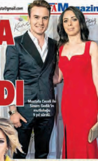
Mustafa Ceceli ile Sinem Gedik'in mutfaklığı 3 yıl sürdü.